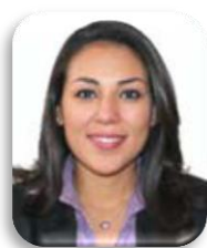
Dip. Aurora Denisse Ugalde Alegría PRI